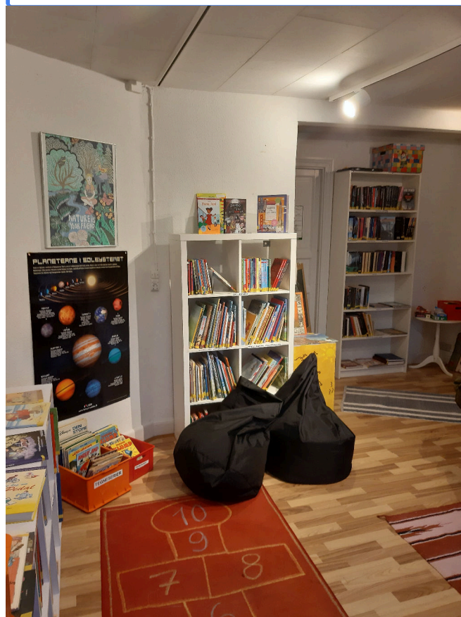
Figur 7: Børnebiblioteket.

Efter skolens bibliotek blev nedlagt, og bøgerne blev reddet fra en container i Holbæk, betød en anonym donation i sommeren 2023, at biblioteksgruppen med tidligere skoleleder Mai-Britt Just gik i gang med at skabe et børnebibliotek i forsamlingshuset. Donationer fra forfattere og borgere har siden skabt grundlag for et hyggeligt rum med børnebøger, som også skolen besøger. Biblioteksgruppen ansøger løbende fonde for at supplere både børne- og voksenbiblioteket.