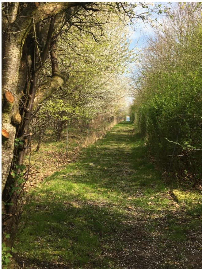
Figur 12: Trampestierne går bla. gennem Hegneskoven.

Holbæk Kommune er lovgivningsmæssig kun forpligtet til at slå stierne, som ligger på de fredede områder, og kun en gang om året. Øvrige stier er de ikke forpligtet til at passe.