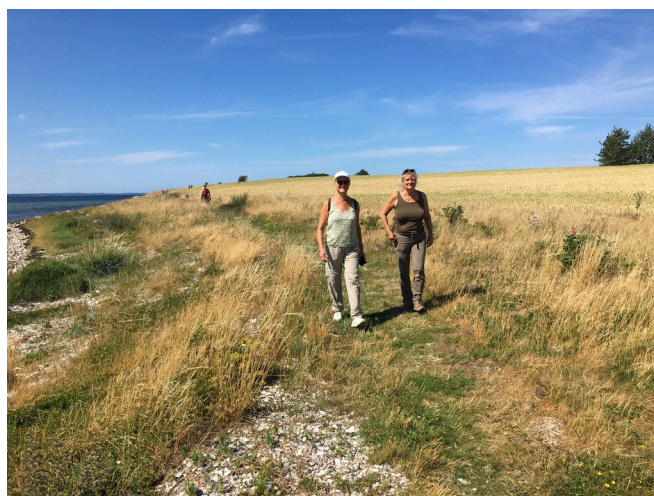
Figur 10: Dejlig vandretur på nordspidsen.

Orøs trampestier består af 14 km sti, som er markeret med pæle og skilte. Stierne, som fører os igennem mange forskellige typer af Orøs kønne natur, kan nogle steder være vanskelige at benytte