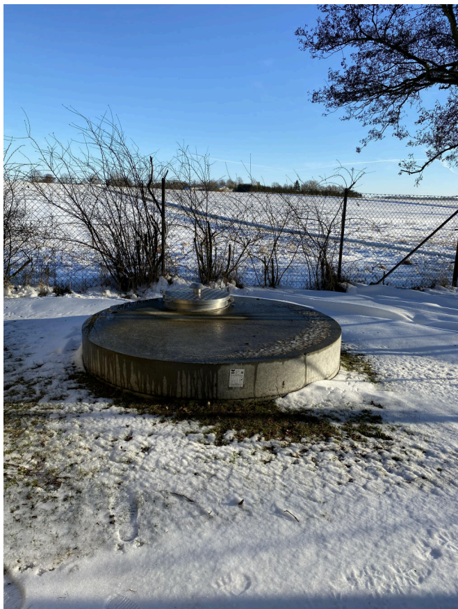
Figur 16: Grundvandet som pumpes op løber igennem et sandfilter. Dette filter skylles jævnligt og skyllevandet udledes til bundfælningsstank, hvor der opsamles okker, inden vandet løber til dræn.

Flere af Orøs vandværker er forbundet. Ikke på den måde, der kaldes en ringforbindelse, men som en nødforbindelse, som muliggør, at vandværkerne kan hjælpe hinanden, når der er behov. F.eks. hvis et vandværk skal reoveres eller i tilfælde af strømsvigt og ledningsbrud. Det giver en god trykghed i hverdagen.