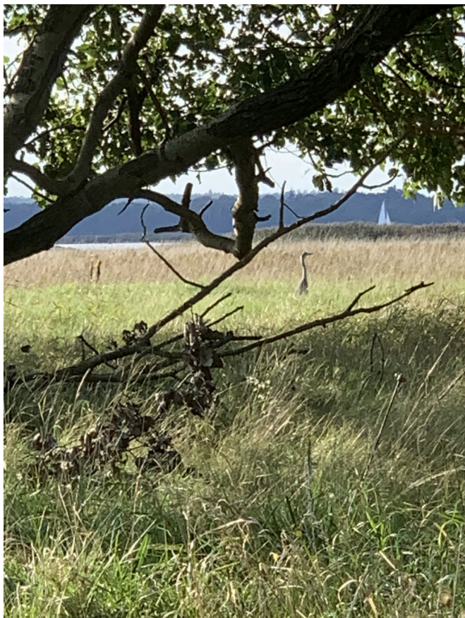
Figur 9: Udsigt til Isefjorden.

Men en ting er at få sit drømmehus og beliggenhed, en anden er at flytte til et ø med ca. 1000 indbyggere med det positive og udfordrende, som følger med.