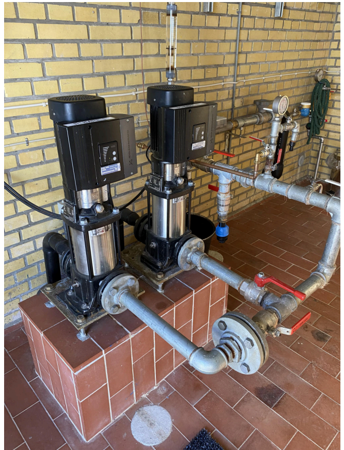
Figur 15: Pumperne som sørger for vandet sendes ud til forbrugerne. En nyligt test imellem de forbundne værker viste, at disse pumper på Orøgaard kan forsyne Salvig, hvis det skulle blive nødvendigt.

Processen med at producere vand er simpel, hvis vandet opfylder alle krav til analyserne. Det pumpes op fra 30–60 meters dybde. Dybden på boringen varierer fra værk til værk. Det oppumpede råvand løber igennem et sandfilter, og „opmagasineres“ i en rentvandstank under vandværket. Derfra kan det sendes ud til forbrugerne.