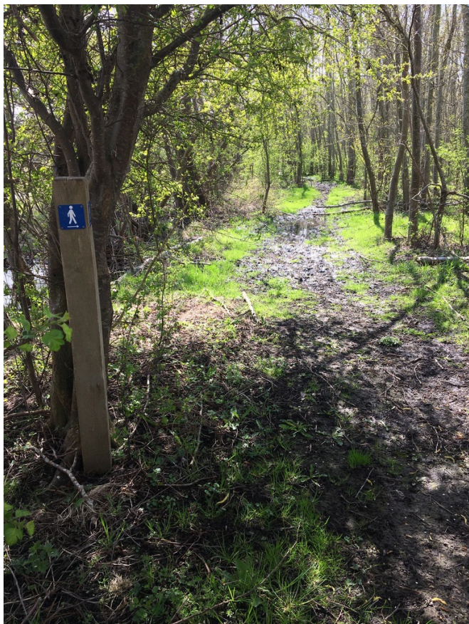
Figur 13: Trampestierne går gennem flere sumpede områder.

Har du lyst til at deltage i arbejdet omkring trampestierne, det være sig løbende observationer eller reparationer, eller vil du være med til at undersøge mulighederne for etablering af gangbroer, så er du velkommen til at kontakte Trampestisgruppen. Du kan enten kontakte et medlem fra gruppen, skrive på fællesmailen: trampesti@oroelokalforum.dk eller komme til mødet d. 13. april.