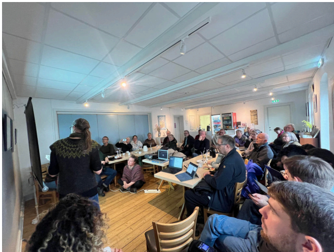
Figur 3:

Syv bachelorstuderende præsenterede muligheder og udfordringer ved at udvikle et energifællesskab på Orø. Herunder fælles varmeløsninger, vedvarende energi og energirenoveringer. Selv om de studerendes analyser er foreløbige, har undersøgelserne peget på en række muligheder for det videre arbejde. Der var stor interesse og mange spørgsmål og input. En central pointe var, at alle på trods af økonomiske ressourcer skal kunne være med. Og at vi skal blive bedre til at udveksle og udvikle vores fælles viden samt inspirere og hjælpe hinanden.