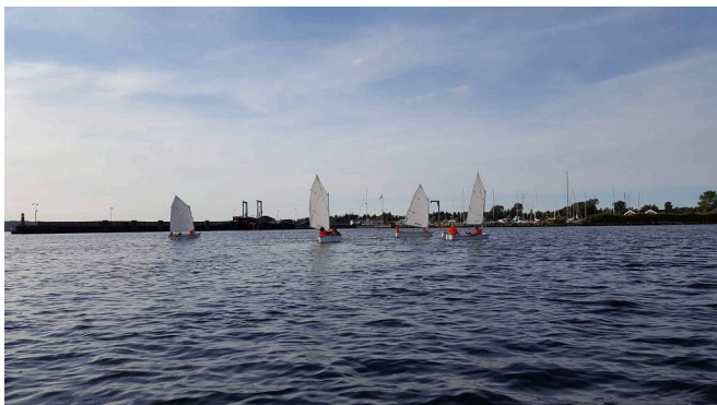
Figur 17: Søspejderne Børre Klan. Foto bragt med tilladelse.