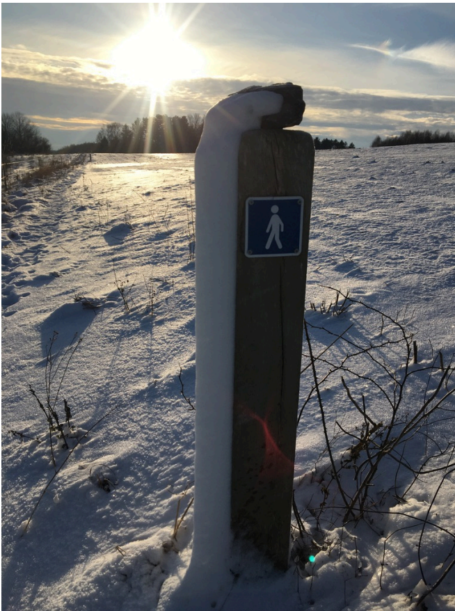
Figur 11: Markeringspæl i sne.

Holbæk kommune var behjælpelige med stolper og skilte, og der blev opsat kort på ruterne, men disse er ikke blevet opdateret eller vedligeholdt i lang tid.