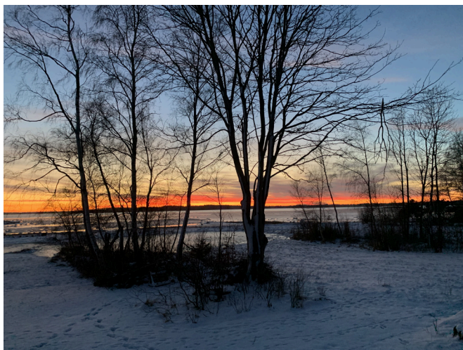
Figur 1: Solnedgang over Tuse Næs.

Der sker mange spændende, sjove og hyggelige ting på Orø – og der opstår ind i mellem problemer og udfordringer som følge af stormflod, Region Sjællands beslutning om læge og tilsvarende.