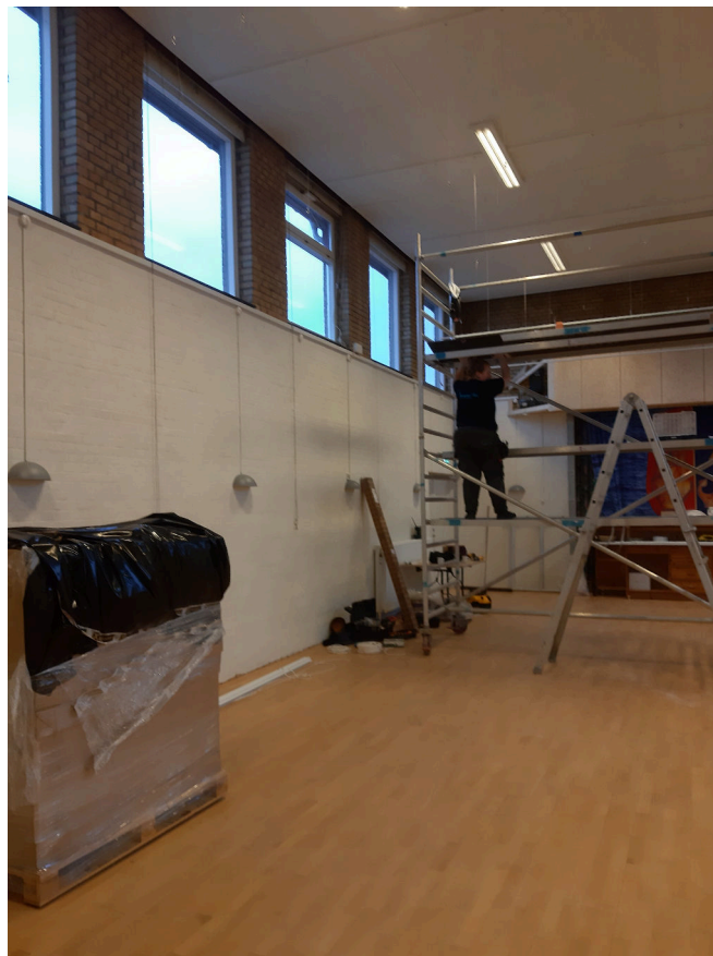
Figur 5: Opsætning af akustikpaneler i Forsamlingshusets store sal.

Nordea-fonden bevilgede for et par år siden en portion penge, der primært går til renovering af den store sal. Både professionelle håndværkere og frivillige er i fuld gang med at gøre salen mere anvendelig, bl.a. ved opsætning af akustikpaneler og bedre belysning.”