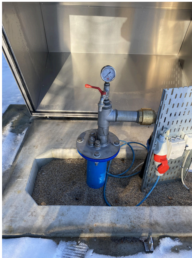
Figur 14: På det lille vandværk i Orøgaard, Næsby trækkes grundvandet op fra en boring på 33 meter. Vandspejlet er dog noget højere oppe.

På Orø er der seks selvstændige vandværker: Salvig, Bybjerg, Fægebakkerne, Børrehoved, Orøgaard-Enghaven og Næsby. Vandværket i Næsby er ikke i drift, men Næsby forsynes fra Salvig. På Orøstrand er der også et lille lokalt vandværk. Der har tidligere været en del flere vandværker, men igennem tiden er nogle lagt sammen. Bybjerg er som det største med 463 aftagere en sammenlægning af Bybjerg, Møllebroen og Sydtoften.