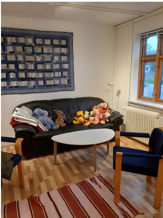
Figur 4:

I denne udgave af Orøposten ser vi på Foreningen Orø Forsamlingshus, der driver forsamlingshuset Orø Kultur- og Forsamlingshus, OKoF.