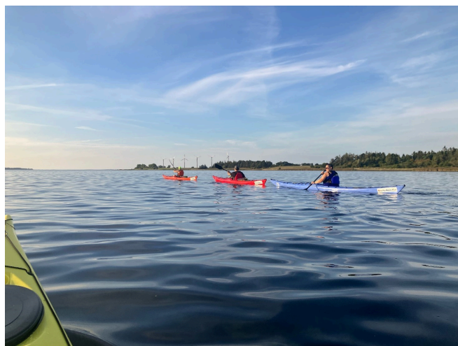
Aftentur på Isefjorden 27. august 2024

Måske dukker der en sæl op, måske et marsvin. Solen laver spejlinger i vandet, og til tider kan dens stråler nå ned til bundens skaller, tang og smådyr.