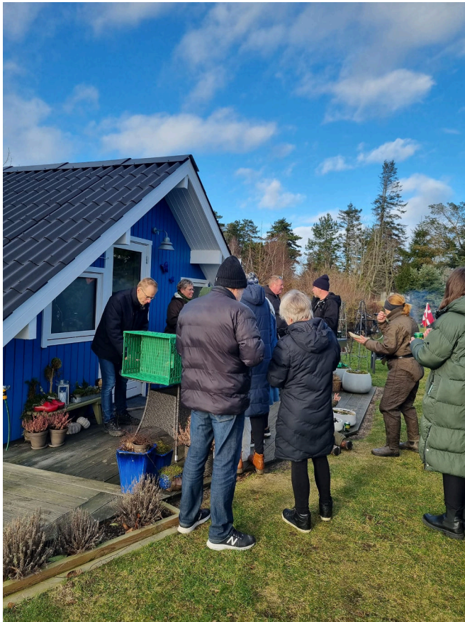
Mellem 30 og 40 medlemmer af foreningen trodsede kulden og deltog i fejringen.

Fejringen begyndte så småt den 3. februar, hvor formandsparret inviterede til pølser og en lille én på selve dagen for stiftelsen af foreningen.