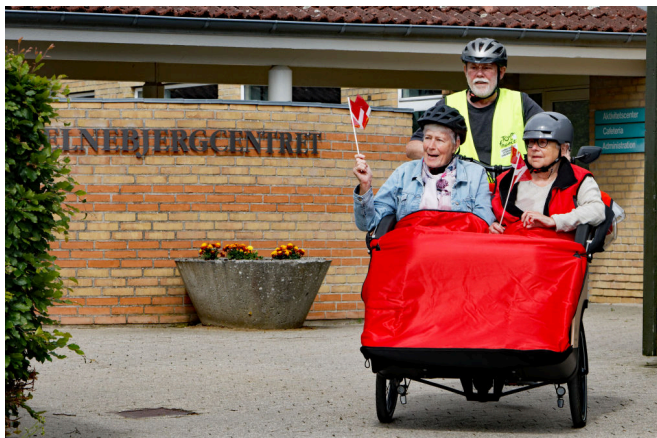
Fra cyklens jomfrutur.