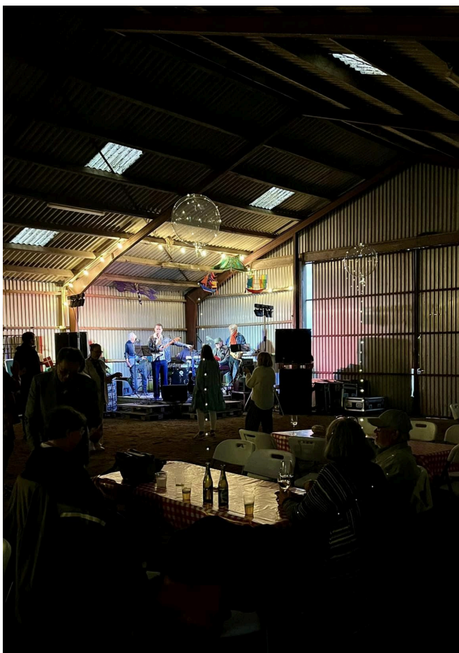
Robin Hoods spiller op til dans.

Efter en dejlig middag med taler og fællessang kunne både store og små give den gas på dansegulvet, da Robin Hoods spillede op i laden.