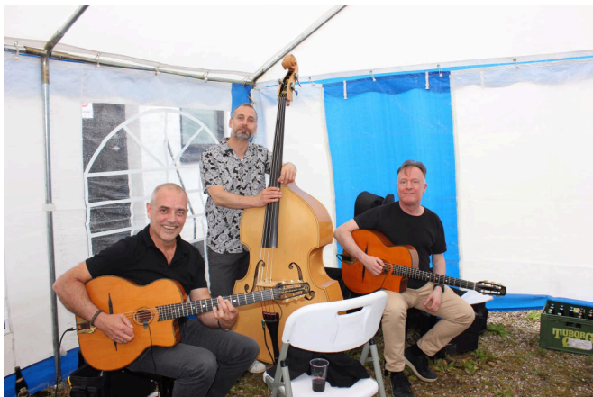
Swing Acoustique spillede swingende Django Reinhardt-inspireret jazz.

Efter en dejlig middag med taler og fællessang kunne både store og små give den gas på dansegulvet, da Robin Hoods spillede op i laden.