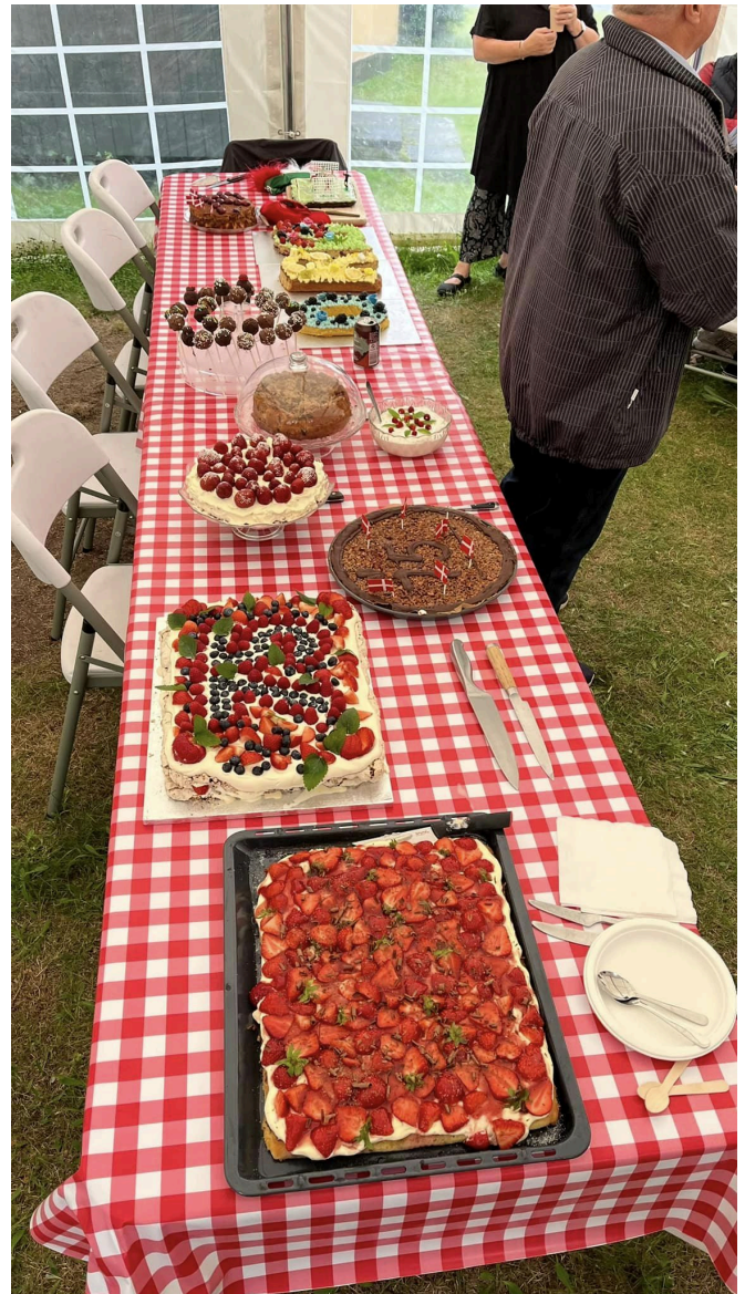
70 voksne og børn gjorde en stor indsats for at gøre kål på de flotte kager.

Og den 22. juni blev de helt store festligheder skudt i gang med en kagekonkurrence på fællesgrunden. Der blev gået til den ved kagebordet, efter dommerne havde udråbt de to vindere i hhv. voksen- og børnekategorien.